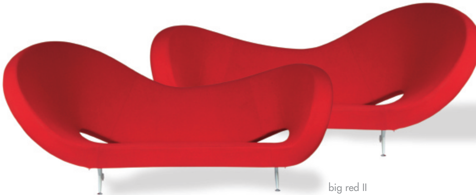
big red II