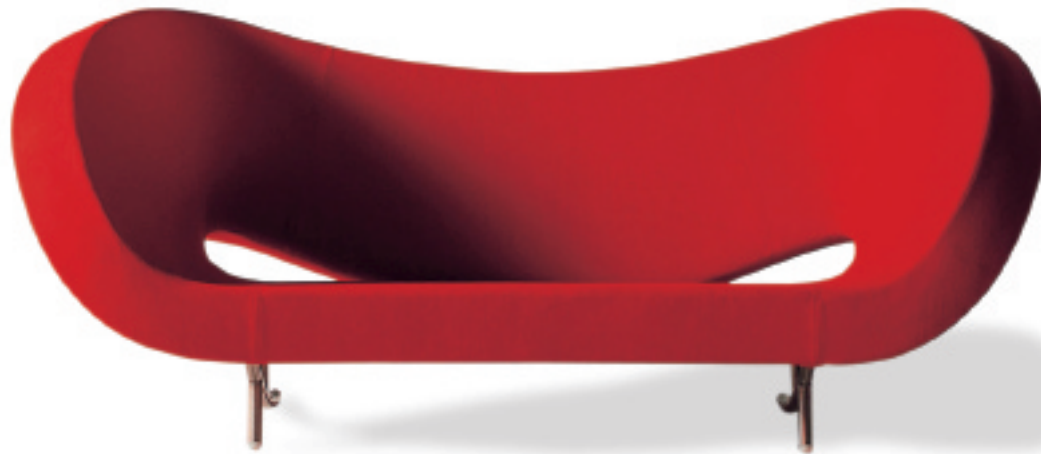
big red I